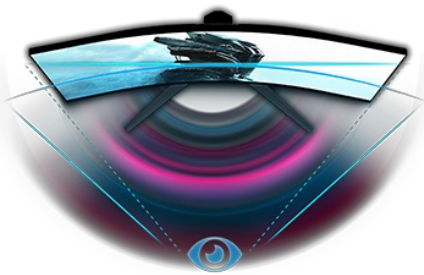
DISEÑO CURVO 1500R

La matriz VA curva 1500R con frecuencia de actualización de 165Hz, MPRT de 0.2 ms y resolución de 2560x1440 le brinda una experiencia de visualización excepcional y garantiza una calidad de imagen excelente. El soporte ajustable en altura asegura que pueda ajustar fácilmente la posición de la pantalla y configuraciones de pantalla permiten la personalización usando los modos de juego predefinidos y personalizados. Además, la función Black Tuner le brinda control sobre las escenas oscuras para asegurarse de que los detalles siempre sean claramente visibles.