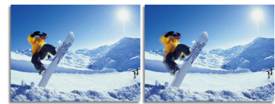
2ms GtG response time > 2ms GtG response time

SmartResponse es una tecnología de mejora exclusiva de Philips que cuando se activa, ajusta automáticamente los tiempos de respuesta a las necesidades de una aplicación específica como los juegos y las películas que requieren tiempos de respuesta más rápidos para producir imágenes sin vibraciones, sin retardo y sin imágenes fantasma