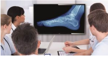
Imagen digital clínica

Los monitores deben mostrar imágenes médicas de forma coherente con alta calidad para que las interpretaciones sean fiables. El procesamiento de las imágenes médicas con escala de grises en los monitores estándar son cuanto menos y en su mayoría incoherentes, lo que no permite utilizarlas en un entorno clínico. Las pantallas de revisión clínica de Philips con preajuste de imagen digital clínica vienen calibrados de fábrica para ofrecer un rendimiento de visualización estándar con escala de grises compatible con DICOM parte 14. Mediante el uso de paneles LCD de alta calidad con tecnología LED, Philips ofrece un rendimiento coherente y fiable a un precio asequible. Para obtener más información, visita http://medical.nema.org/