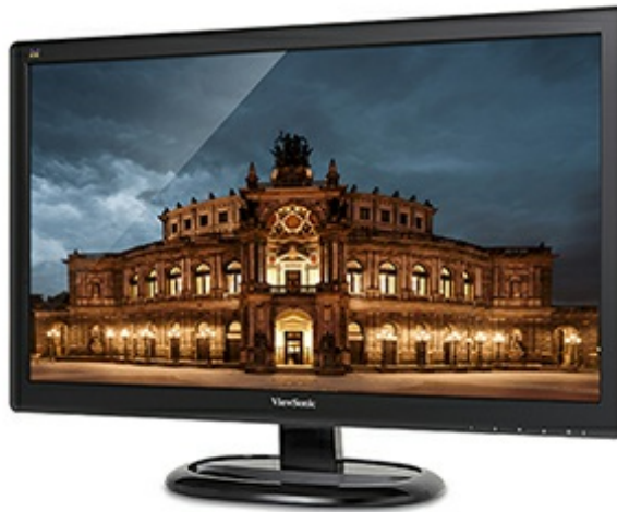
3000:1 Static Contrast Ratio