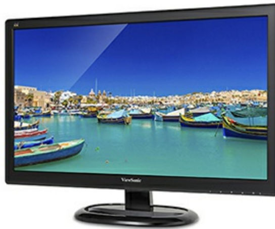
ViewSonic Flicker-Free Technology